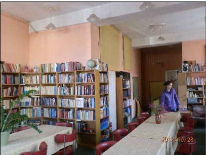
DRZWI DO RENOWACJI W CZYTELNI